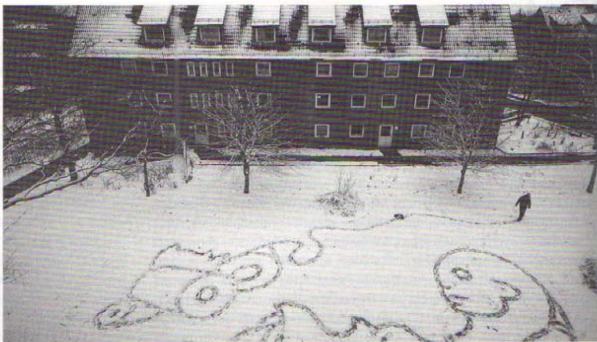
Nominiert für die Goldene Kuh: «Frau Rolle» von Johannes Kalden.