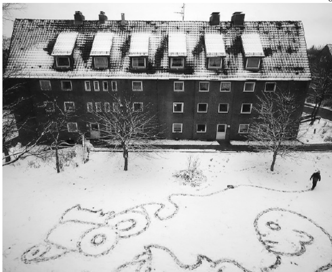
Aus dem Film «Frau Rolle» des deutschen Künstlers Johannes Kalden

geflogen? Wissen Sie, wie es bildlich aussieht, wenn man sich in der Liebe verstrickt? – Lassen Sie sich überraschen, auf welcher vielfältigen Weise Künstler/innen ihre Visionen auf Film festhalten.